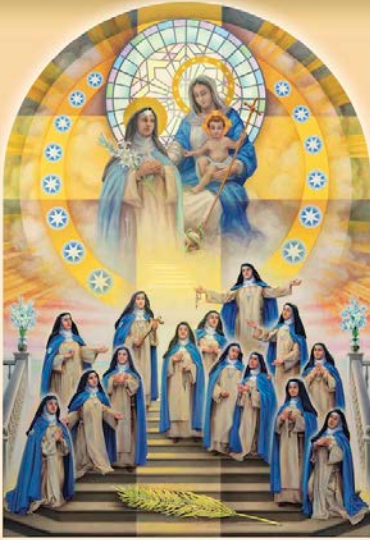
BEATIFICACIÓN DE LAS MÁRTIRES CONCEPCIONISTAS DE MADRID MARÍA DEL CARMEN LACABA ANDÍA Y XIII COMPAÑERAS CATEDRAL DE LA ALMUDENA, MADRID. SÁBADO 22 DE JUNIO 2019, 11 H.

22 de junio: II aniversario de la Beatificación de nuestras queridas 14 hermanas mártires Concepcionistas. Nos seguimos encomendando a su intercesión. ¡Beata María del Carmen Isabel Lacaba Andía y compañeras mártires, rogad por nosotros!