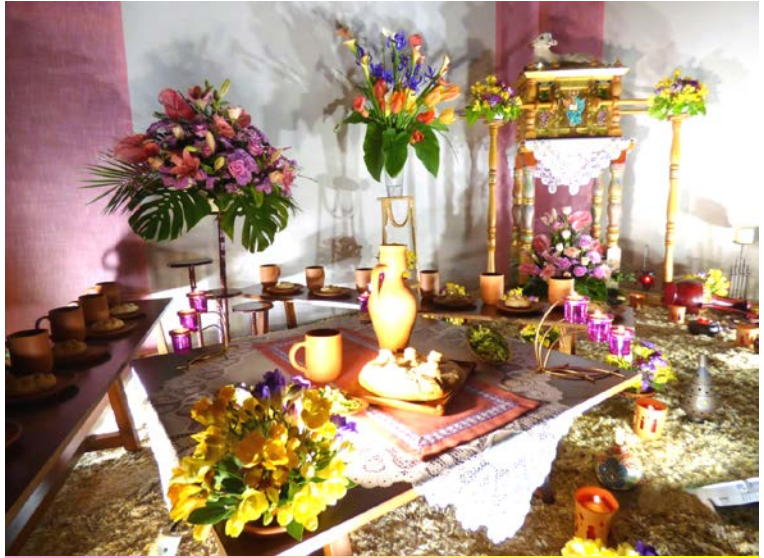
Monumento en la iglesia del Monasterio de Monjas Concepcionistas de Alcázar de San Juan

Estamos en presencia de Jesús Sacramentado, mirémosle levantándose, quitándose el manto, tomando un lienzo y ciñéndose con él, como lo hacían los esclavos y, como un esclavo, se pone a lavar los pies sucios y, sin duda, muy sucios de los apóstoles, y a enjugárselos con el lienzo que se había ceñido, sin cuidar de que la humedad del lienzo mojaría su túnica. Nada tuvo en cuenta.